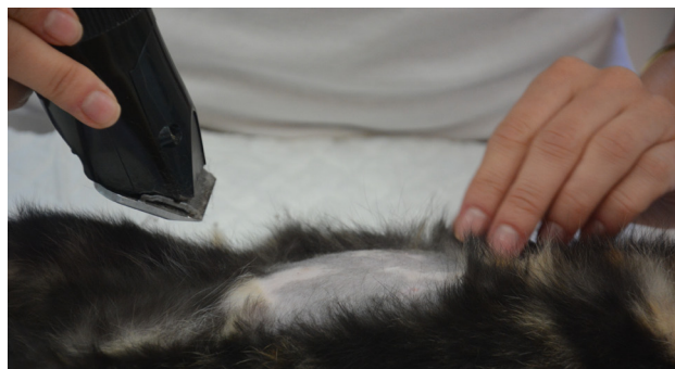
Pred posegom kirurško polje obrijemo in razkužimo.