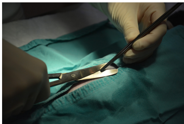
Pod popkom se napravi majhna zareza.