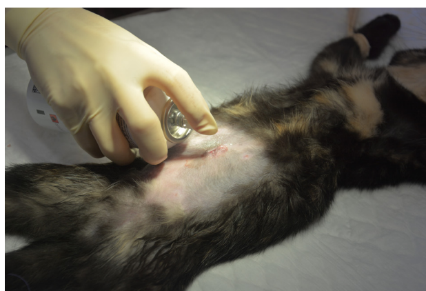
Nanos zaščitnega spreja.

Zdravil muca ne dobi za domov. Med posegom dobi protibolečinsko injekcijo, ki drži 2 dni. Daljše dajanje ni potrebno, saj je poseg minimalno boleč. Zaščitnega ovratnika mucam ne dajemo, saj si rane običajno ne ližejo. V kolikor se to zgodi, ovratnik namestimo naknadno.